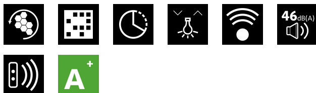
8527_NorBreeze ISLA DEIMOS 1000 RF